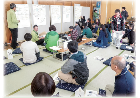
ビジターセンターの展示手法に関する検討会

一番の収穫は、今までバラバラで横の連絡もなかったそれぞれのビジターセンターの素顔が見えてきて、一緒に連携していこうという機運が生まれたことです。