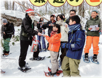
サンタさんからプレゼント 岩手山地区PV撮影